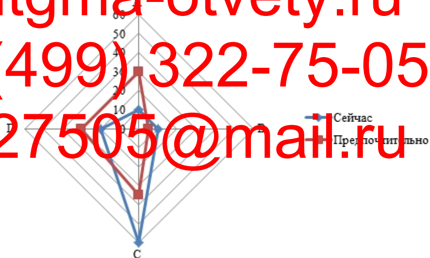
Рисунок 2.4. — Профиль элемента корпоративной культуры государственных служащих — «Важнейшие характеристики»